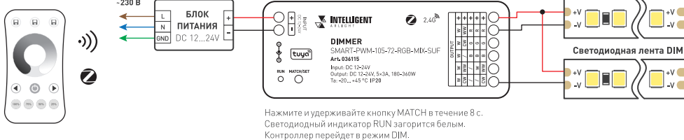
Рис. 1. Схемы подключения диммера SMART-PWM-105-72-RGB-MIX-SUF

3.7. Переведите устройство в режим привязки к мобильному приложению (доступно только при использовании конвертера Wi-Fi — ZigBee, например SMART-ZB-801-62-SUF):